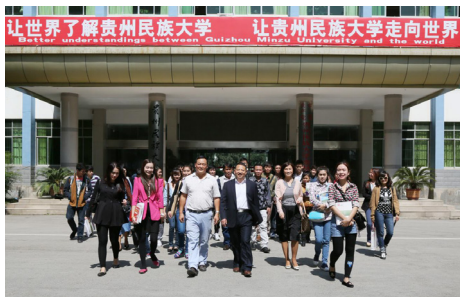
商学院招收的外国留学生

商学院前身为经济管理系，始建于 1986 年，2004 年 7 月更名为经济管理学院，2009 年 12 月再次更名为商学院。2016 年 6 月，商学院与管理学院（前身政治系，始建于 1978 年）合并，组建为新的商学院。商学院现设有经济学、金融学、经济统计学、工商管理、市场营销、会计学、电子商务、人力资源管理、公共事业管理、行政管理、劳动与社会保障等 11 个本科专业，覆盖经济学、工商管理和公共管理三大门类，拥有应用经济学、工商管理和公共管理三个校级重点学科。此外，在民族学一级硕士点下设置“中国少数民族经济”和“民族地区行政管理”两个二级学科硕士点。截至 2017 年 9 月末，各类在校学生人数达 2580 余名。学院现有教职工 110 名，90% 以上的教师具有博士或硕士学位，具有副高以上职称教师共 55 名。学院秉承“高素质、厚基础、宽口径、强能力”的人才培养理念，坚持以本科教学为中心，以学科及专业建设为重点，培养具有创新、踏实、团队协作精神和实践能力较强的应用型专门人才为定位，立足贵州，面向全国，努力探索“教学立院、科研强院、服务兴院”的特色发展道路。